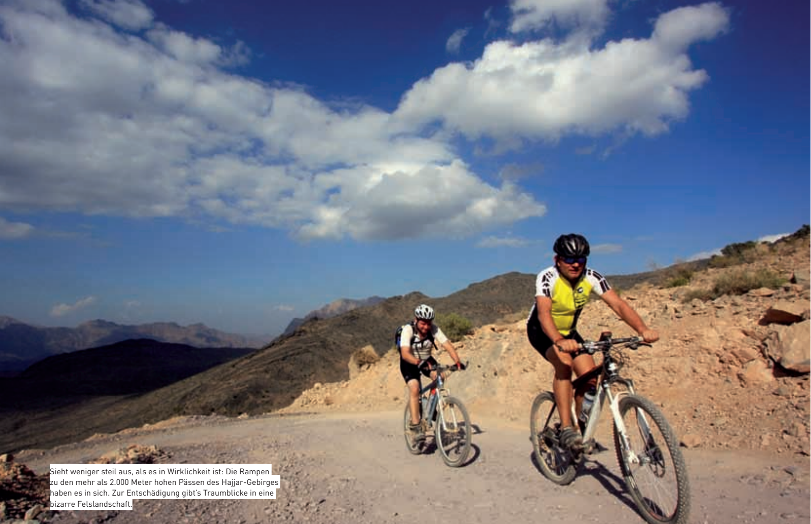
Sieht weniger steil aus, als es in Wirklichkeit ist: Die Rampen zu den mehr als 2.000 Meter hohen Pässen des Hajar-Gebirges haben es in sich. Zur Entschädigung gibt's Traumblicke in eine bizarre Felslandschaft.

Was, es wird doch nicht etwa...? – Oh doch, es wird! Und zwar schneller und stärker, als wir das je für möglich gehalten hatten.